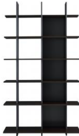
REGALELEMENT SCHMAL LACK WEISS