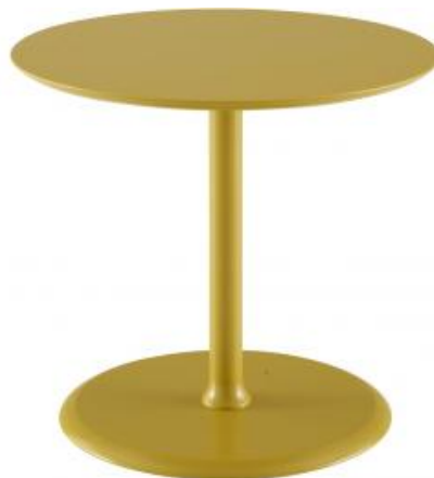
BEISTELLTISCH MIT 2 PLATTEN LACK TONGRAU