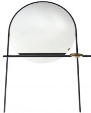
SPIEGEL / STUMMER DIENER