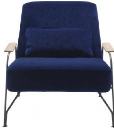
SESSEL KOMPLETTES ELEMENT