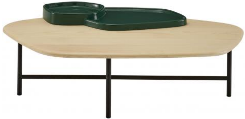
COUCHTISCH ESCHESCHWARZ / KERAMIK EBENSCHWARZ