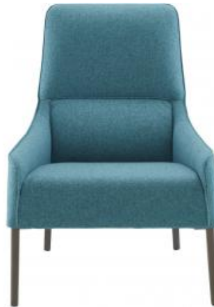
SESSEL MIT ARMLEHNEN