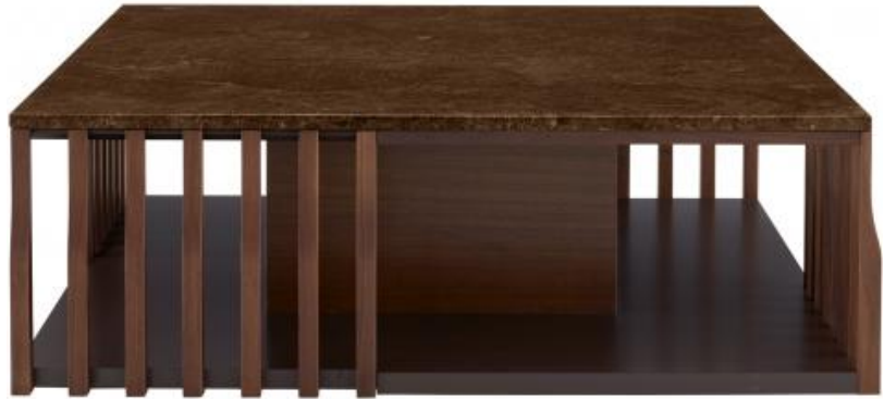
COUCHTISCH FURNIER NUSSBAUM DUNKEL PLATTE MARMOR GRÜN